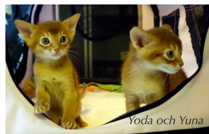
Yoda och Yuna

Nyfikna och modiga spanade de runt i lägenheten. Mina andra katter var fortfarande kvar i sommarhuset den dagen.