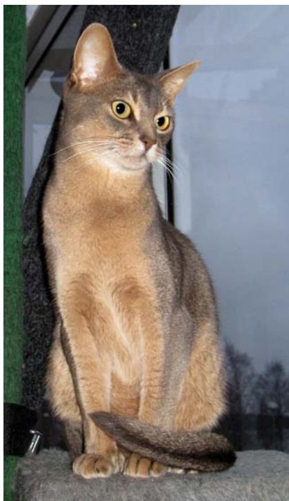
DK*Saltvigs Webster bor numera i centrala Umeå med älvutsikt. Där bor han med en annan blå abygrabb: (N)Qute as Ever av Sina Bass (nedan).