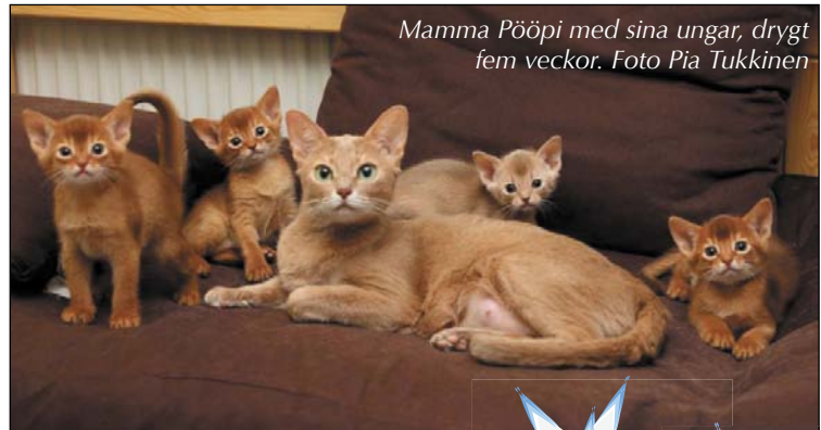
Mamma Pööpi med sina ungar, drygt fem veckor.