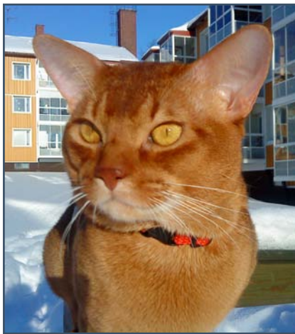
Tintin på promenad.

Det har varit en otrolig snörik vinter, vilket har inneburit att Rambo har tillbringat mesta tiden att sova. Tintin har väl lite motvilligt gått ut med mej korta stunder, snö är inget den här herren gillar. Han är lika tjurig