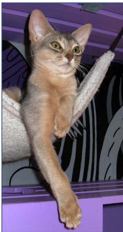
Zesam fem månader ung.

Han kom snabbt och smidigt in i kattgruppen. Bästa kompisen är som väntat Olga. Hennes kullbror flyttade ju sent hemifrån så hon blev mycket glad över en ny lekkompis. De brottas och busar varje dag. Izzi tar inte lekinitiativ med Zesam, men är förvånadsvärt tålmodig med honom när han kommer farande med sina ninja-attacker.